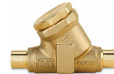
Valve de retenue HV

Valves pour piscine au chlore et accessoires Catégorie : 062