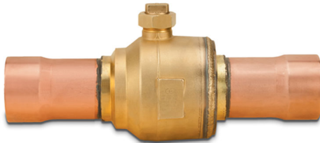
Valve à bille de réfrigération