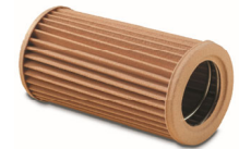
de remplacement Pièce centrale

Référence de la liste de prix : 062 – Valves de réfrigération Superior