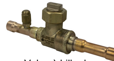
Valve à bille de réfrigération avec raccord d'accès