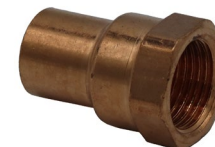
Raccord X F Adaptateur