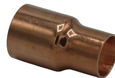
Raccord X C Réduit