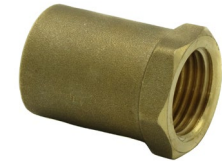
Adaptateur femelle réduit