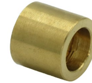
Raccord X F réduit ouvert