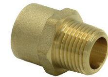
Adaptateur mâle réduit