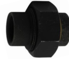
FIP x FIP