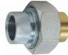
FIP galvanisé x FIP laiton